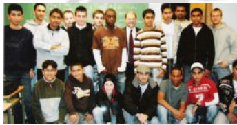
Schirmherr Bundesminister Olaf Scholz zu Besuch bei BGK

“Der Unterschied durch die Nachhilfe ist bei den Schülern zu erkennen.” Lehrerin einer 9. Klasse