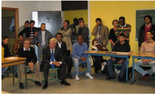
Hamburgs 1. Bürgermeister Ole von Beust zu Besuch bei BGK