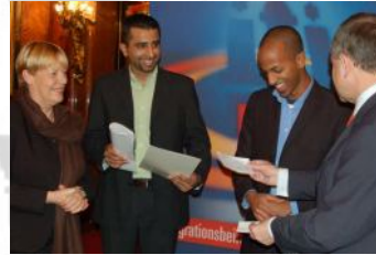
Preisverleihung 2. Platz Hamburger Integrationspreis 2006

“Ohne diese Nachhilfe hätte mein Sohn sicher seinen Abschluss nicht geschafft.” Mutter eines Teilnehmers